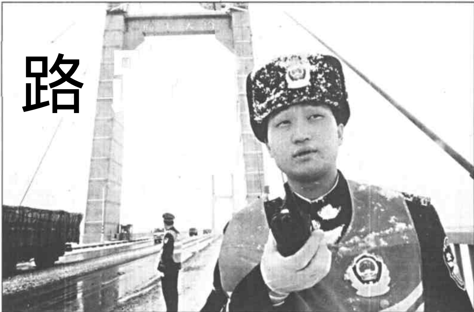
胜利黄河大桥是我市境内的一条主干道。11时30分，交警疏导指挥过往车辆。

银装素裹的雪景把城市装扮的异常美丽，市民们在兴高采烈地踏雪观光时，交通警察却有一种压力，他们每一个人都清楚：确保道路安全是他们义不容辞的职责。