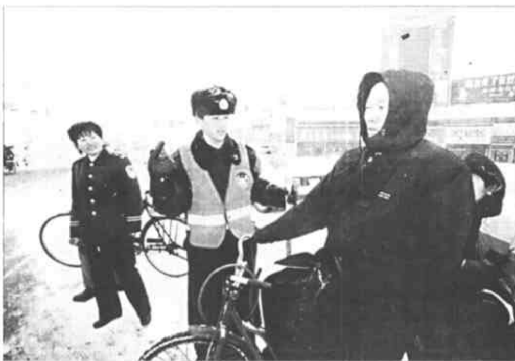
8时30分，西城中心岗民警提醒过往行人注意安全。