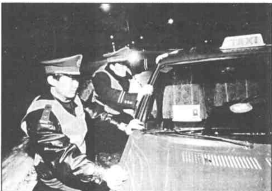
►23时45分，在雪的下层结了冰块，时有车辆侧滑，巡逻民警帮助推车。