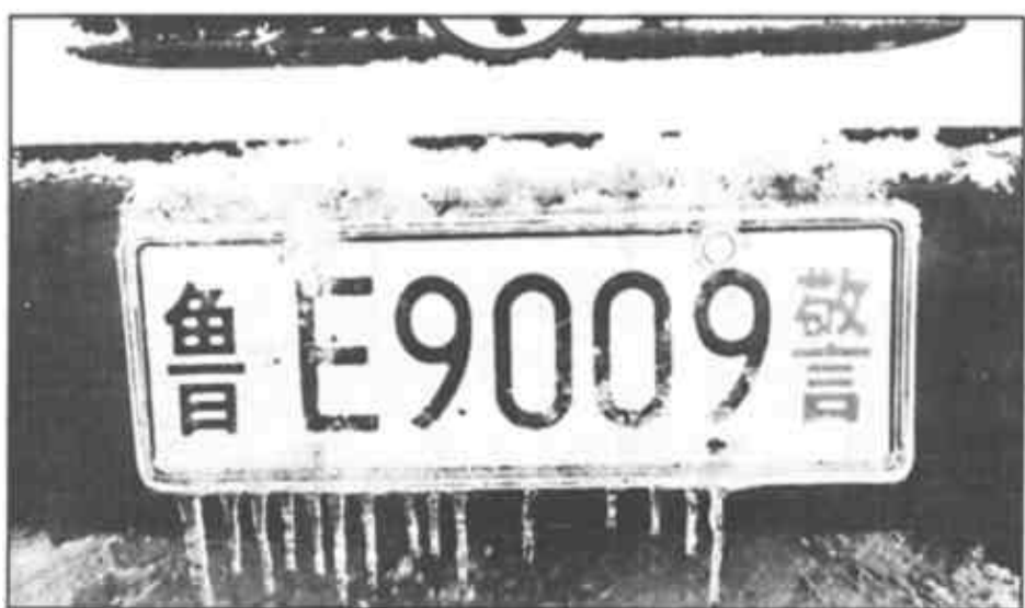
►警车24小时往返巡逻，这一天，行驶400多公里。