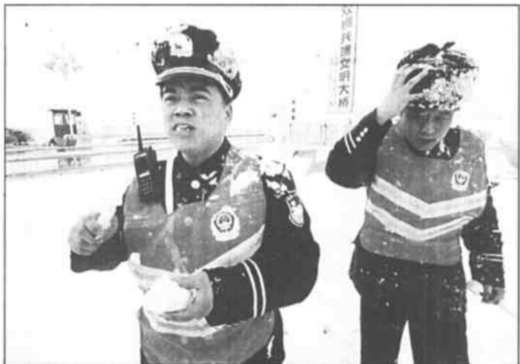
►12时，在胜利黄河大桥上的值勤民警一棵大葱一个馒头填饱了肚子。