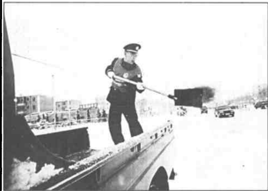
7时45分，直属二大队民警在城区主要路段、十字路口撒盐融雪。